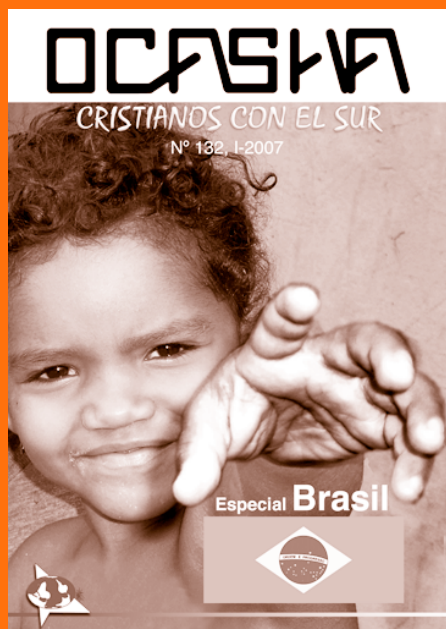
EN PORTADA. Niño brasileño