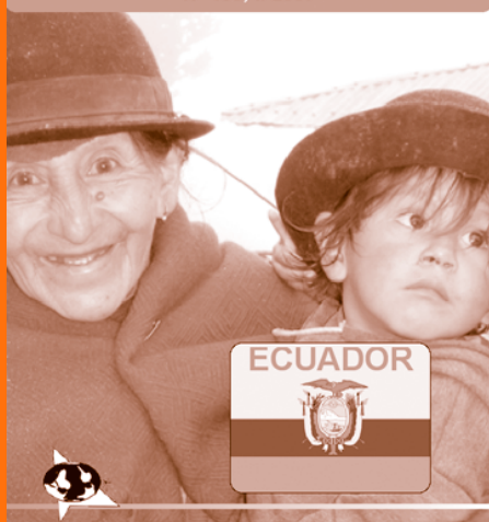
EN PORTADA: Abuela ecuatoriana con su nieto.